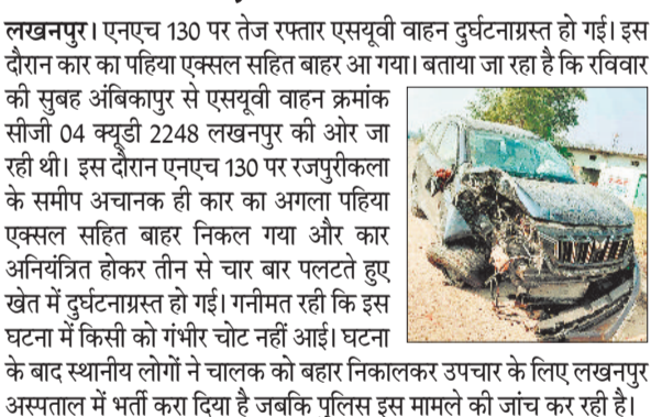
लखनपुर। एनएच 130 पर तेज रफतार एसयूवी वाहन दुर्घटनाग्रस्त हो गई। इस दौरान कार का पहिया एक्सल सहित बाहर आ गया। बताया जा रहा है कि रविवार की सुबह अम्बिकापुर से एसयूवी वाहन क्रमांक सीजी 04 क्यूडी 2248 लखनपुर की ओर जा रही थी। इस दौरान एनएच 130 पर रजपुरीकला लोड ट्रेलर वाहन गायत्री खदान के समीप भी अनियंत्रित होकर पलट गया है, लोगों का कहना है यहां पर कोयला परिवहन की आपसी प्रतिस्पर्धा होने की वजह से इस तरह की घटनाएं आए दिन घटित हो रही हैं, जिससे कभी भी गंभीर हादसा होने की संभावना बनी रहती है।

डेडरी पुल के समीप ट्रेलर चालक वाहन से अपना नियंत्रण खो बैठा और वाहन अनियंत्रित होकर सड़क किनारे खेत में पलट गया, दुर्घटना होने उपरांत वाहन चालक मीके से फरार हो गया है, ग्रामीणों ने बताया कि इसी तरह एक और कोयला लोड ट्रेलर वाहन गायत्री खदान के समीप भी अनियंत्रित होकर पलट गया है, लोगों का कहना है यहां पर कोयला परिवहन की आपसी प्रतिस्पर्धा होने की वजह से इस तरह की घटनाएं आए दिन घटित हो रही हैं, जिससे कभी भी गंभीर हादसा होने की संभावना बनी रहती है।