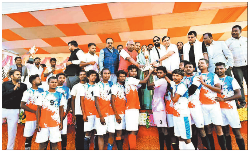
विजेता टीम को पुरस्कार देते सांसद व अन्य।

मुख्य अतिथि सांसद चिंतामणि महाराज की उपस्थिति में खेल गया। फाइनल मुकाबला शाहपुर व गोपातु टीम के बीच खेला गया। शाहपुर की टीम ने बेहतर खेल कर प्रदर्शन करते हुए गोपातु टीम को 3-0 से पराजित कर प्रतियोगिता अपने नाम की। मुख्य अतिथि सांसद चिंतामणि महाराज ने विजेता टीम को पुरस्कार देते सांसद व अन्य।