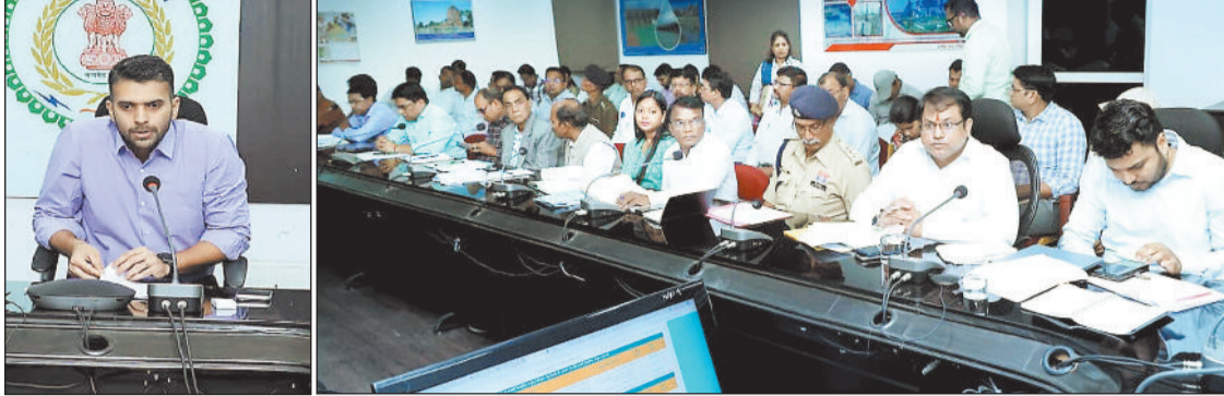
बैठक लेते कलेक्टर और उपस्थित विभागीय अधिकारी।

कलेक्टर ने कहा कि सभी उपार्जन केंद्रों में साफ-सफाई, फेंसिंग, विद्युत व्यवस्था, कंप्यूटर व यूपीएस, इंटरनेट कनेक्शन, आर्द्रतामापी यंत्र, कांटा-बाट, बारदाना, पेयजल, शौचालय, मानव संसाधन, तारपोलिन और सीसीटीवी कैमरा जैसी सभी मूलभूत सुविधाएं अनिवार्य रूप से उपलब्ध होनी चाहिए। उन्होंने कहा कि धान परिवहन पर नियंत्रण हेतु 10 अंतरराज्यीय एवं 15